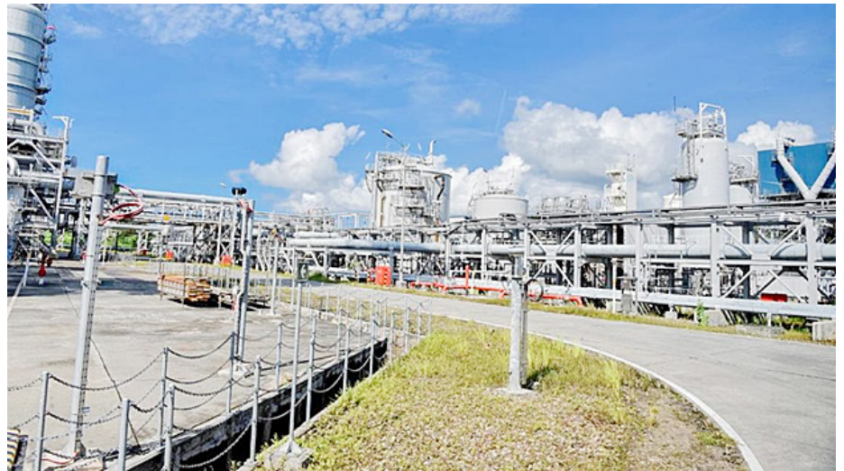
Kilang LNG Tangguh yang dioperasikan oleh BP Berau Ltd, di Teluk Bintuni, Papua Barat.

“Kami menerima keluhan dan kekecewaan masyarakat pekerja asal Papua bersama Serikat Pekerja LNG Tangguh karena rekrutmen yang berjalan ini tidak memberi peluang bagi orang Papua. Padahal BP telah menargetkan mempekerjakan 85 persen tenaga kerja asal Papua pada tahun 2029, se-