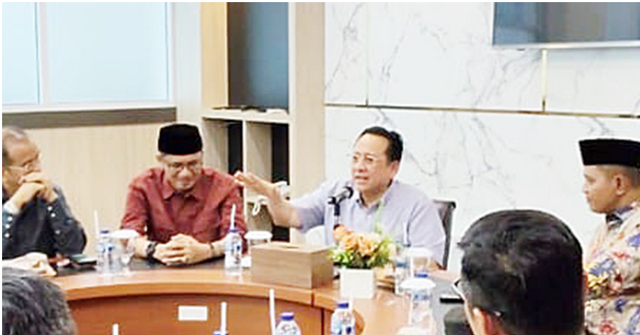
Senator Irman Gusman (tengah) dalam sebuah diskusi di Jakarta.