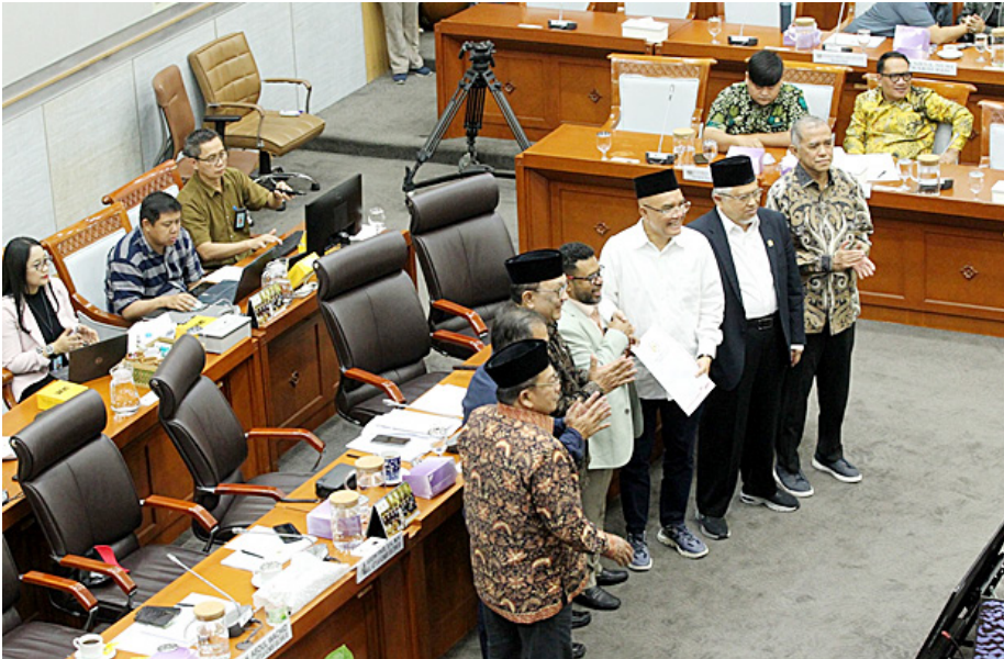
Ketua Komite III DPD RI Filep Wamafma didampingi Wakil Ketua Komite III Dailami Firdaus menyerahkan pandangan DPD RI kepada Ketua Komisi VIII DPR RI Marwan Dasopang.