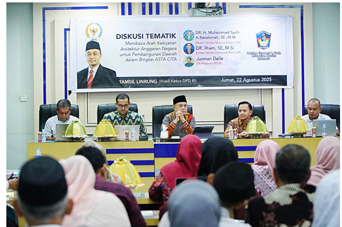
Wakil Ketua DPD RI Tamsil Linrung dalam diskusi tematik bertajuk “Membaca Arah Arsitektur Anggaran Negara untuk Pembangunan Daerah dalam Bingkai Asta Cita”, Makassar, Sulsel.

Potensi dana publik yang dapat diserap melalui instrumen ini dinilai sangat besar. Tamsil menyebut sumbernya bisa berasal dari sektor perbankan, asuransi, dana pensiun, BPJS Ketenagakerjaan, hingga Badan Pengelola Keuangan Haji, dengan jumlah