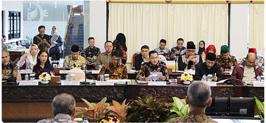
Pertemuan BAP DPD RI dengan BPK Perwakilan Provinsi Daerah Istimewa Yogyakarta (DIY).

BPK DIY melaporkan bahwa hingga Semester I 2025, dari 6.480 rekomendasi senilai Rp233,20 miliar, sebanyak 94,77 persen telah sesuai dengan ketentuan senilai Rp36,68 miliar. Meski demikian, berdasarkan hasil pemeriksaan kinerja, masih terdapat 1.660 permasalahan ketidakefektifan kinerja, terutama dalam pengelolaan APBD, pelayanan kesehatan,