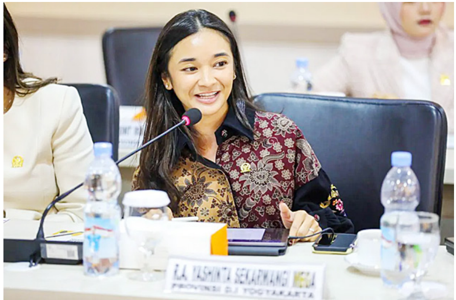
Anggota DPD RI Yashinta Sekarwangi Mega.

Yashinta yang juga Anggota Komite IV DPD RI mengungkapkan bahwa dirinya sudah mengetahui rencana pemotongan Danais sejak awal. Menurutnya, informasi tersebut sudah