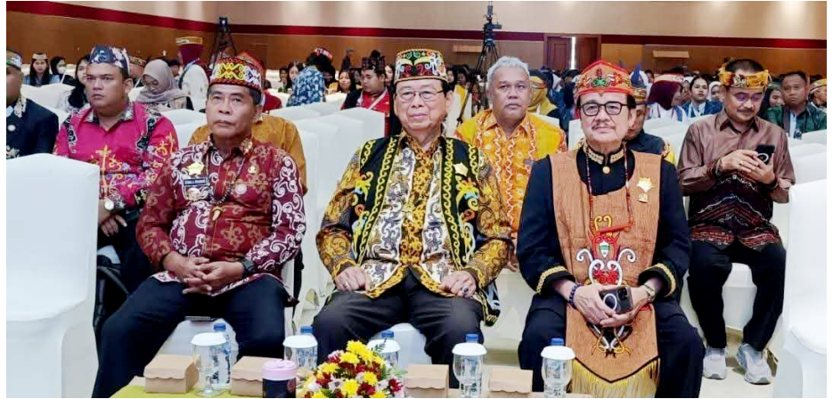
Anggota DPD-RI dapil Kalteng, Agustin Teras Narang (depan kanan) saat menghadiri kegiatan Pumpung Hai Borneo di Palangka Raya.

Teras Narang mengajak seluruh elemen masyarakat daerah, khususnya di daerah pemilihannya, untuk menjaga situasi yang damai dan sejahtera demi kepentingan bersama. “Pemerintah daerah dan wakil rakyat, dalam semangat Huma Betang bersama tokoh adat, tokoh masyarakat, termasuk mahasiswa, diharapkan meningkatkan koordi-