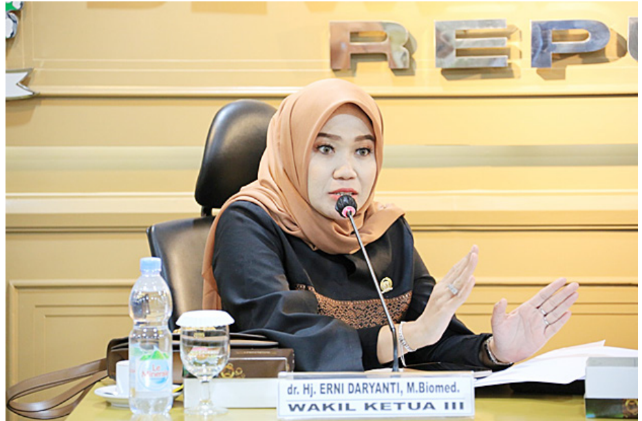
Wakil Ketua Komite III DPD RI, Erni Daryanti

Senator asal Kalimantan Tengah itu menegaskan pentingnya peran negara hadir secara lebih kuat dalam memfasilitasi kebutuhan masyarakat muslim Indonesia, khususnya dalam penyelenggaraan ibadah haji