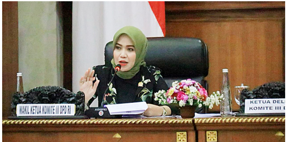
Anggota DPD RI Erni Daryanti

Dalam pandangannya, penanggulangan cacingan harus menjadi program prioritas pemerintah selain pencegahan stunting . Menurut Erni, penanggulangan cacingan dan pencegahan stunting memiliki keterkaitan erat karena keduanya dapat menghambat pertumbuhan anak yang sehat, cerdas, dan produktif. Penanggulangan cacingan juga mendukung penyerapan gizi yang optimal, sehingga dapat mencegah terjadinya stunting .