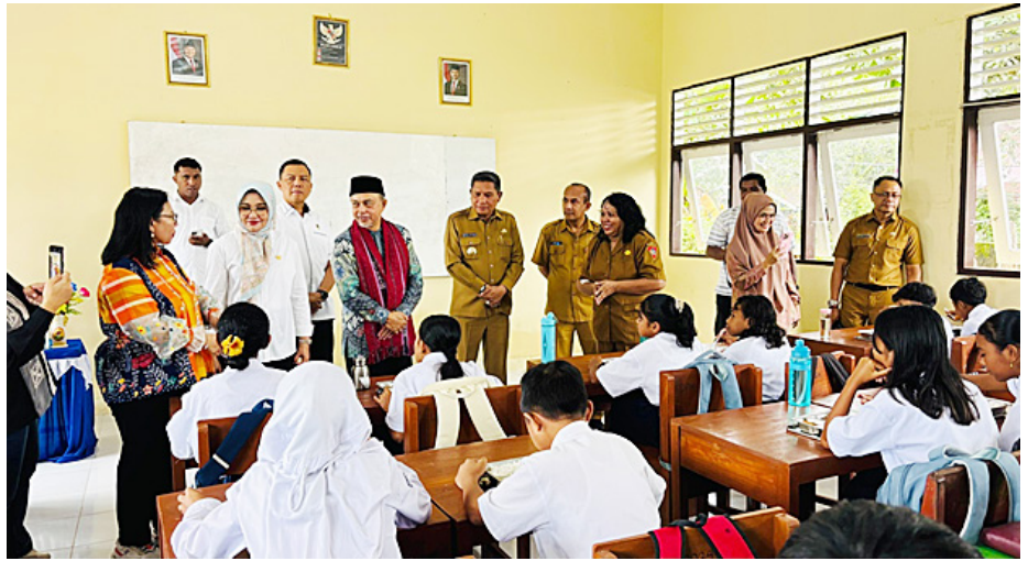
Wakil Ketua DPD RI Tamsil Linrung bersama anggota DPD RI Novita Anakotta, dan Evi Apita Maya meninjau program MBG di Kota Ambon, Maluku.

Selain itu, Tamsil juga melakukan peninjauan di sekolah-sekolah penerima manfaat dan berinteraksi langsung dengan siswa-siswi SMP Negeri 15 Ambon serta SD Cendekia Ambon.