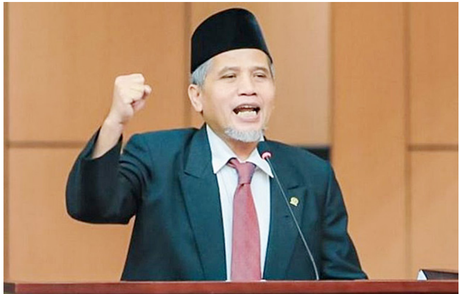
Anggota DPD RI Muhammad Nuh.

Muhammad Nuh menekankan, peristiwa tersebut harus menjadi evaluasi bagi pemerintah. Pemerintah, menurutnya, perlu cepat dan tanggap merespons berbagai permasalahan serta tuntutan yang muncul dari masyarakat. Misalnya, terkait ketidakadilan ekonomi yang kerap men-