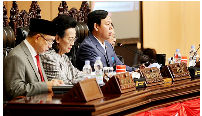
Ketua DPD RI Sultan B Najamudin didampingi para wakil ketua saat memimpin Sidang Paripurna DPD RI pengesahan pimpinan alat kelengkapan DPD RI Tahun Sidang 2025-2026.

Pemilihan ulang pimpinan alkel DPD RI tersebut didasarkan pada Peraturan DPD RI Nomor 1 Tahun 2022 tentang Tata Tertib dan dilakukan setiap tahun sidang sesuai mekanisme yang berlaku. Prosesnya diawali melalui rapat di masing-masing subwilayah untuk