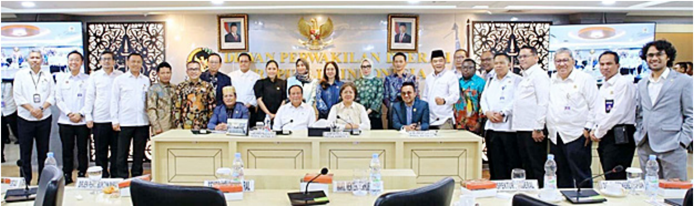
Pimpinan dan anggota Komite II DPD RI bersama Wamenhub Suntana usai menggelar rapat kerja.