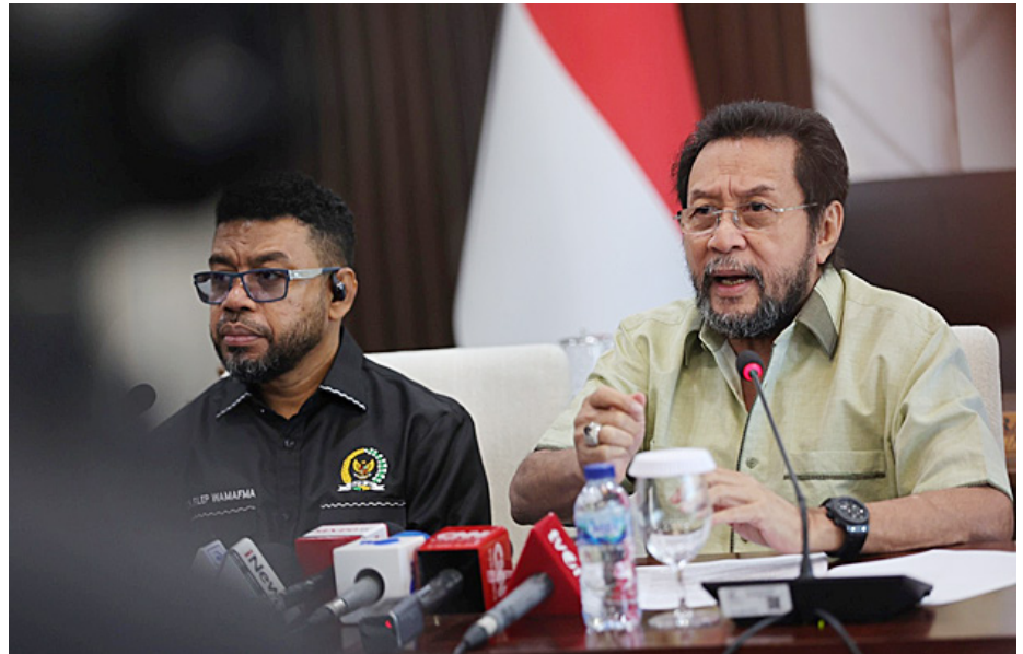
Wakil Ketua DPD RI Yorrys Raweyai (kanan) bersama Filep Wamafma.

Yorrys mempertanyakan pola penanganan aparat dalam merespons aksi massa. Menurutnya, pengamanan seharusnya dilakukan secara terukur, terencana, dan mengedepankan pendekatan persuasif serta humanis, bukan represif atau memo-