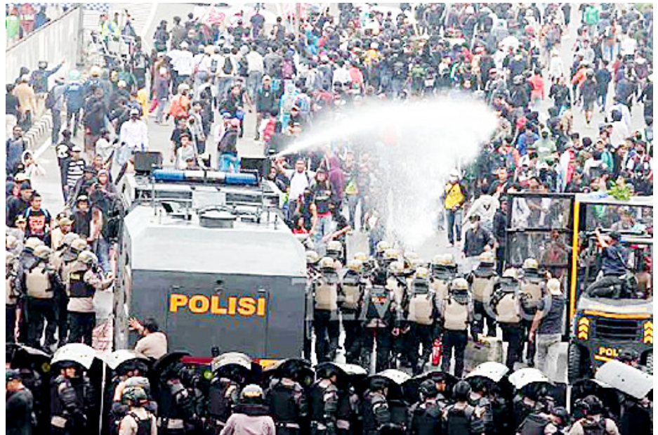
Suasana pembubaran masa aksi demo di depan Gedung MPR/DPR/DPD RI, Senin (25/8/2025).

Massa Partai Buruh ini sudah membubarkan diri sejak siang hari. Namun, menjelang sore, muncul lagi massa lainnya. Aksi ini terus berlanjut sam-