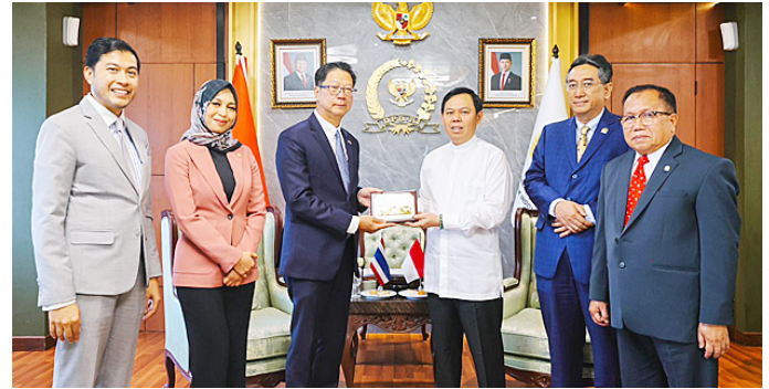
Ketua DPD RI Sultan B Najamudin didampingi Pimpinan BKSP DPD RI menerima kunjungan kehormatan Duta Besar Thailand untuk Indonesia Prapan Disyatat.

Duta Besar Thailand Prapan Disyatat menyambut baik inisiatif tersebut. Menurutnya, pembentukan FSAT akan memberikan kontribusi positif bagi penguatan diplomasi parlemen di kawasan. “Forum ini sangat potensial untuk memperkuat kerja sama antarparlemen, khususnya senat. Thailand siap mendukung dan melakukan diskusi lanjutan