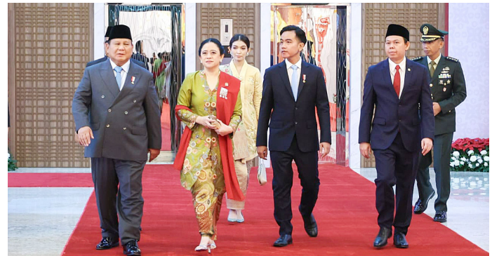
Presiden Prabowo Subianto saat menghadiri Rapat Paripurna DPR RI dengan agenda menyampaikan RAPBN dan Nota Keuangan 2026.

Dalam RAPBN 2026, alokasi TKD direncanakan hanya sebesar Rp650 triliun. Angka ini turun signifikan, yakni Rp214,1 triliun atau 24,7 persen, dibandingkan outlook 2025 yang mencapai Rp864,1 triliun. Pemangkasan ini sekaligus menempatkan alokasi TKD 2026 sebagai yang terendah dalam lima tahun terakhir. Padahal, sejak 2021, tren realisasi TKD cenderung meningkat: Rp785,7 triliun pada 2021, Rp816,2 triliun di 2022, Rp881,4 triliun pada 2023, lalu