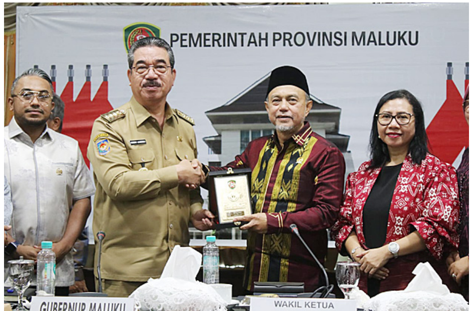
Komite IV DPD RI pada agenda kunjungan kerja di Maluku Utara.

Gubernur menyoroti ketentuan UU Nomor 1 Tahun 2022 dan Peraturan Pemerintah Nomor 35 Tahun 2023 yang membatasi