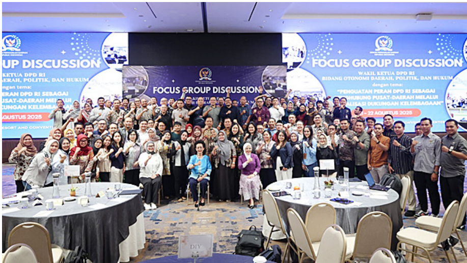
Kegiatan focus group discussion bertema “Penguatan Peran DPD RI sebagai Penghubung Pusat-Daerah melalui Optimalisasi Dukungan Kelembagaan” di Bogor, Kamis (21/8/2025).