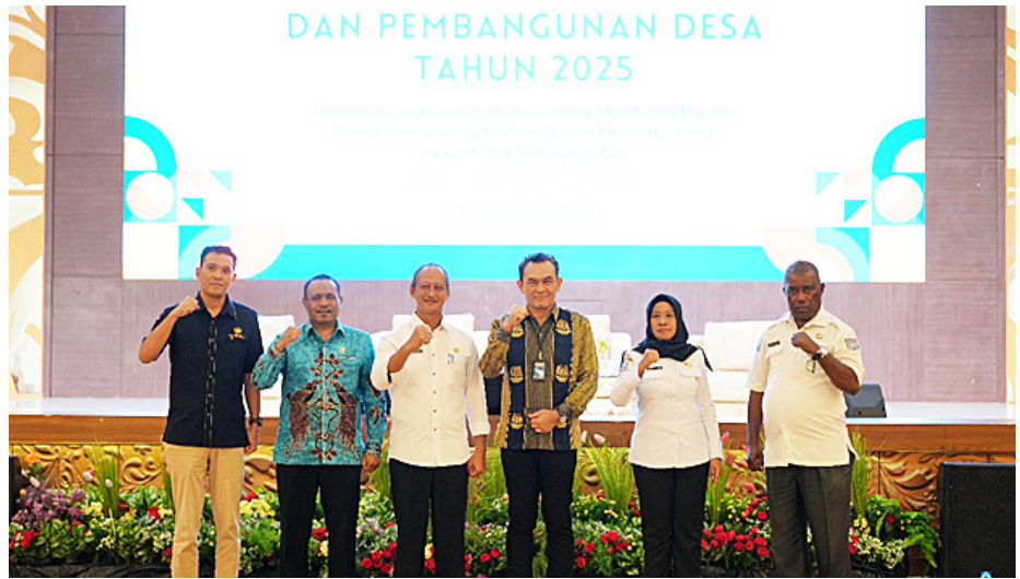
Workshop Evaluasi Pengelolaan Keuangan dan Pembangunan Desa yang diselenggarakan BPKP Perwakilan Papua Barat Daya, di Kabupaten Sorong.

Mamberob menegaskan, dana desa bisa berdampak signifikan bagi peningkatan