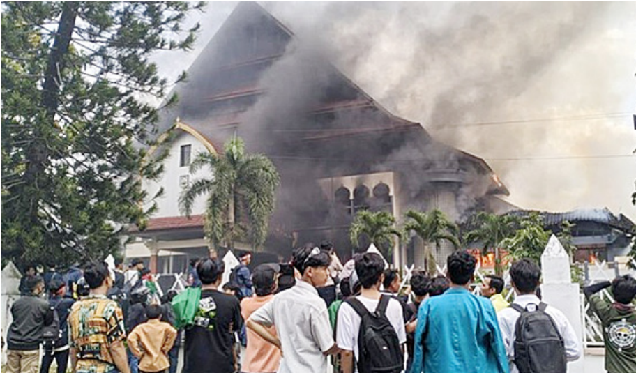
Gedung DPRD NTB dibakar massa unjuk rasa.