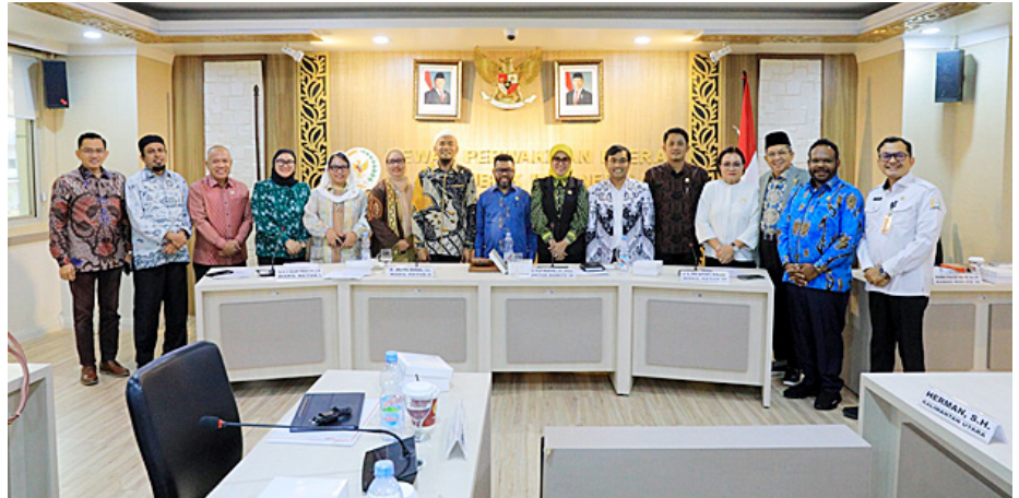
Komite III DPD RI usai RDPU bersama PGRI dan FSGI.

“Komite III DPD RI mendorong agar revisi UU Sisdiknas benar-benar menghadirkan sistem pendidikan nasional yang inklusif, berkeadilan, dan sesuai dengan kebutuhan zaman. Pendidikan adalah hak setiap warga negara, dan negara