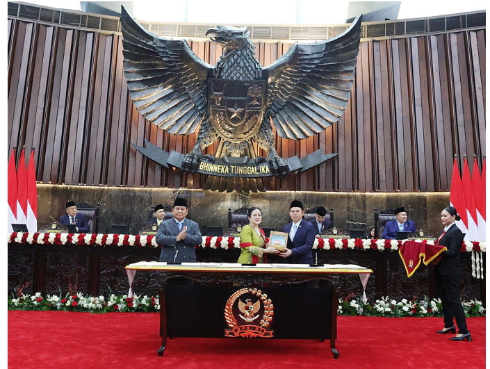
Ketua DPD RI Sultan B Najamudin menerima RAPBN dan Nota Keuangan 2026 dari Ketua DPR RI Puan Maharani.

Sultan menjelaskan, pemerintah pusat kini lebih banyak menyalurkan anggaran pembangunan daerah melalui program-program kementerian dan lembaga. Beberapa di antaranya adalah program ketahanan pangan, Koperasi Desa Merah Putih, Sekolah Rakyat, serta Makan Ber-