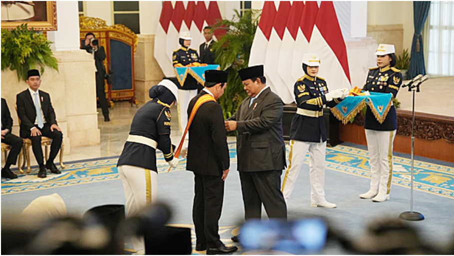
Presiden Prabowo Subianto memasangkan tanda penghargaan Bintang Republik Indonesia Utama kepada Ketua DPD RI Sultan B Najamudin.